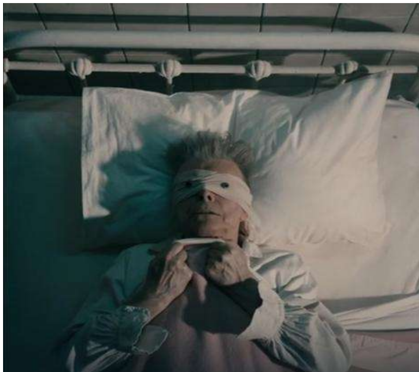
Slika u bolničkoj postelji iz spota za pesmu "Lazarus"

"Kameleon" svetskog roka preminuo je 8. januara ove godine, ali je jedna od retkih ličnosti koja je živela rokerski život punim plućima bez želje da pusustane. To dokazuje i činjenica da je se osamnaest meseci hrabro borio protiv raka, a to javnost ne sazna. Čak je par dana pre smrti objavio i album Blackstar na kojem kao da se oprostio od fanova kada je za numeru "Lazarus" snimio spot gde on leži u bolničkoj postelji dok peva "Ja sam u raj".